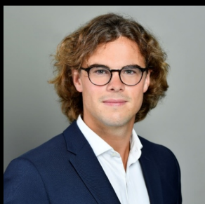
Hippolyte Storez Financements

Université Paris-Nanterre, master de lettres