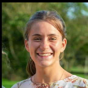
Louise de Jaeger Logistique

Sorbonne Université, licence de philosophie