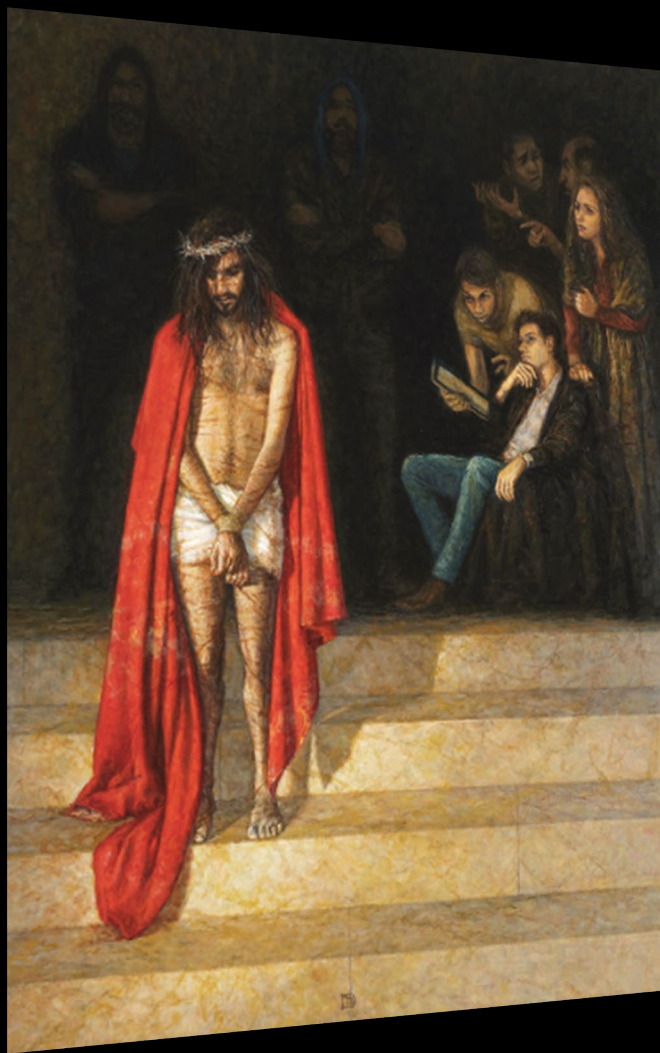
Jésus est condamné à mort Peinture à l'huile