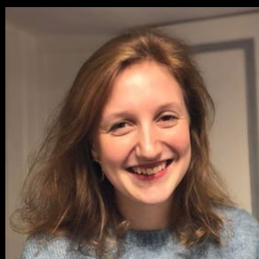
Héroïse de Condé Mariages